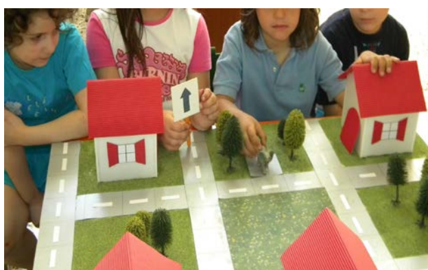
Σχήμα 2. Η μακέτα με την «πόλη των ζώων»

Σε μια μακέτα παρουσιάστηκε «η Πόλη των Ζώων» χωρισμένη σε τετράγωνα (σχ. 2). Η «Πόλη» περιελάμβανε δρόμους, δέντρα, μια λίμνη και τα σπίτια των ζώων.